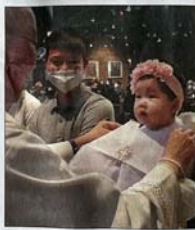
Ein Taufkleid für das neue Mitglied der Gemeinde.